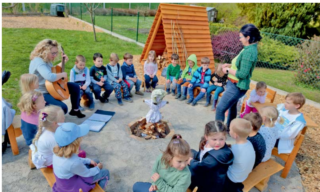
Nové ohniště si odbylo svou premiéru stylově – při pálení čarodějnic.

Každý z nás by měl mít nějaké oblíbené místo, kde rád odpočívá a cítí se šťastně a bezpečně. Moje oblíbené místo bylo na vesnické zahradě, kde jsem vyrostla. Nejen kvůli tomu jsme chtěli zvelebit zahradu v naší školce. Naši snahou bylo využít velký podlouhlý prostor zeleně k rozmanitým aktivitám, které povedou ke vzdělání a zároveň vznikne oblíbené místo pro naše děti. Máme nový školní vzdělávací program, který se jmenuje „Zaléváme kořínek“ a připodobňuje vývoj rostliny k vývoji dítěte. Na podzim při nástupu do školky