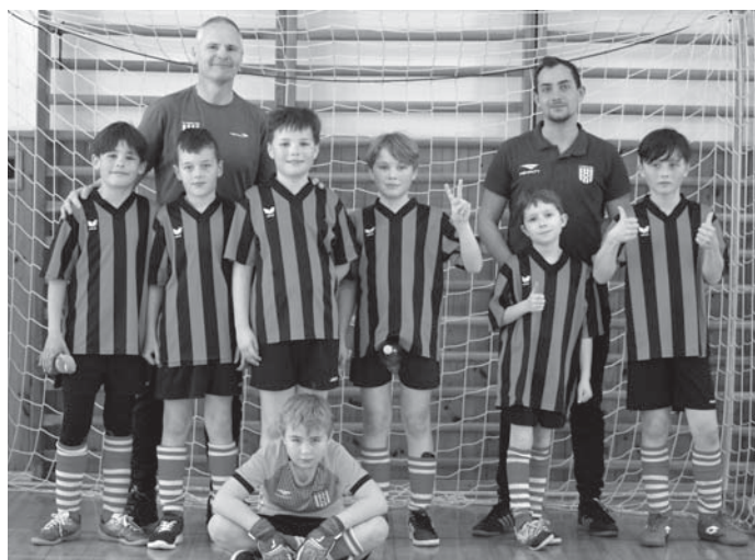
Mladší žáci B

Máme velkou radost z účasti našich mládežníků na mezinárodním turnaji Budweis cup, který se uskuteční poslední červnový víkend v areálu Složiště – SK Dynamo a v areálu Doprastavu – TJ Malše Roudné. Turnaje se zúčastní nejen týmy z Čech, ale například i z Itálie, Španělska, Německa, Rakouska atd. Minimálně 70 týmů ze všech koutů Evropy. A-tým doznal několika změn v hráčském kádru. Do zahraničního angažmá v nejméně vhodnou dobu, tedy v polovině rozehrané sezóny, odešel brankář Bartizal. Bohužel jeho odchod nás postavil před nepříjemnou