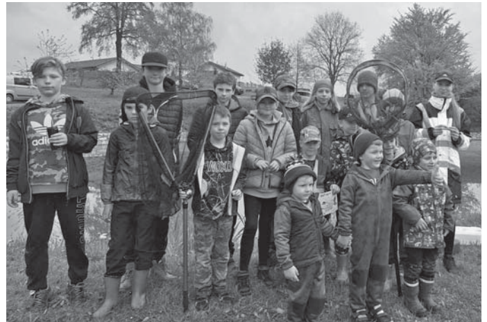
Ani rozmarné počasí neodradily děti od hojné účasti na závodech.