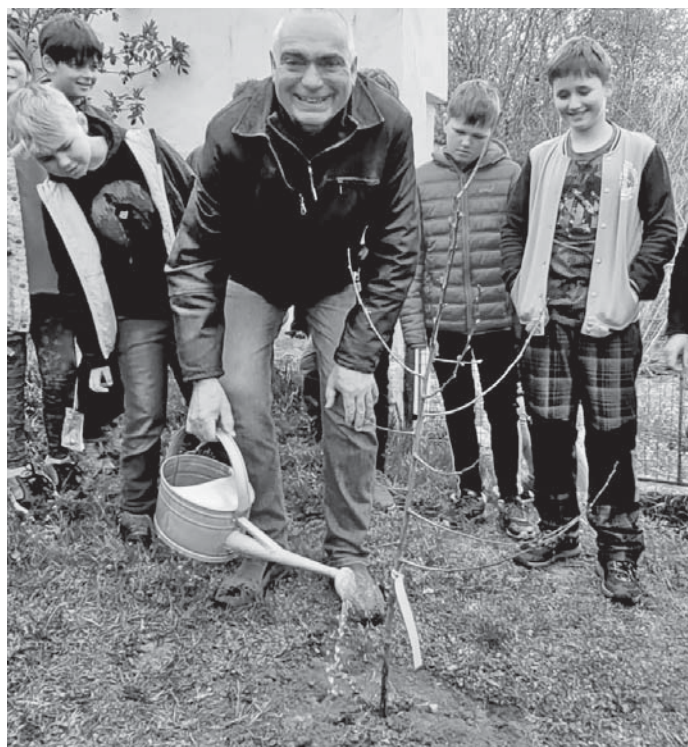
Den Země Nedabyle 2022.