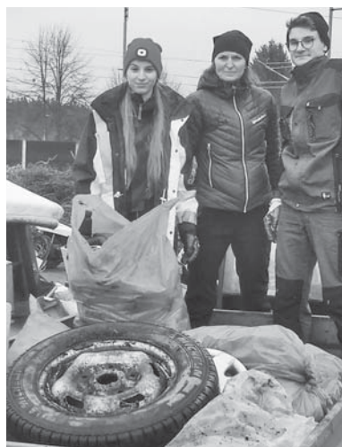
I letos se podařilo v katastru naší obce sebrat hromadu odpadků.

Na druhého dubna letošního roku byla v naší drahé vlasti po dlouhých dvou letech opět nastartována celorepubliková dobrovolnická úklidová akce „Uklidme Česko“. Ta probíhá na celém území České republiky. Jejím cílem je uklidit nelegálně vzniklé černé skládky a nepořádek. Společně v jeden den. U nás v Nové Vsi jsme vždy napřed, a tak abychom všechny zmátli, pořádáme tuto akci již o den dříve – tedy prvního dubna. Důvod je v celku prostý. Následný den je naplánován svoz velkoobjemového odpadu, a tak to po stránce odvozu a likvidace krásně do sebe zapadá. V tomto případě se nám pravděpodobně po stránce propagační nepodařilo oslovit dostatečné množství zájemců. Budiž poděkování všem členům naší rodiny, kteří se rozhodli dobrou věc podpořit. Ti, kteří se omluvili nebo se nedostavili, budou mít znovu šanci na podzim. mp