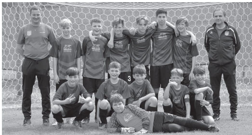
Mladší žáci A