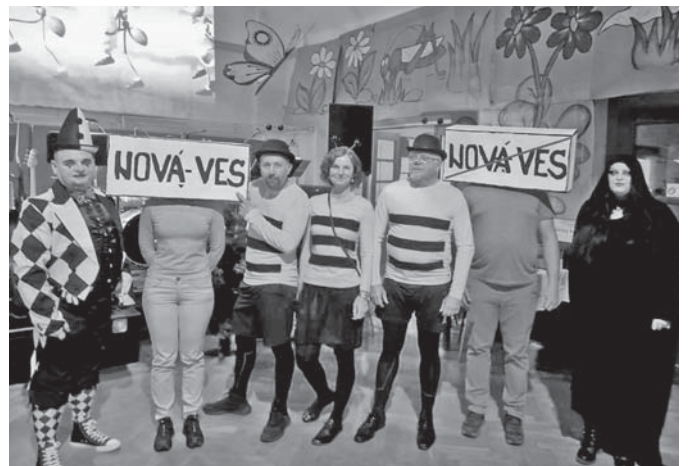
Tématem letošních Šibřinek byla rozkvetlá louka.