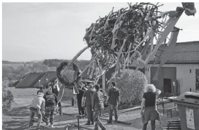
Stavění májky je skvělá příležitost pro setkání sousedů.