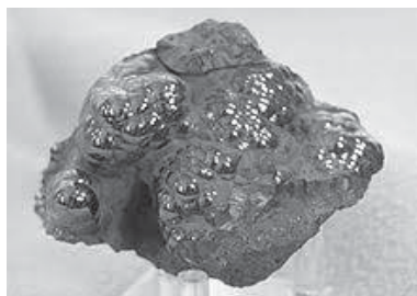
Dvě různé struktury hematitu.