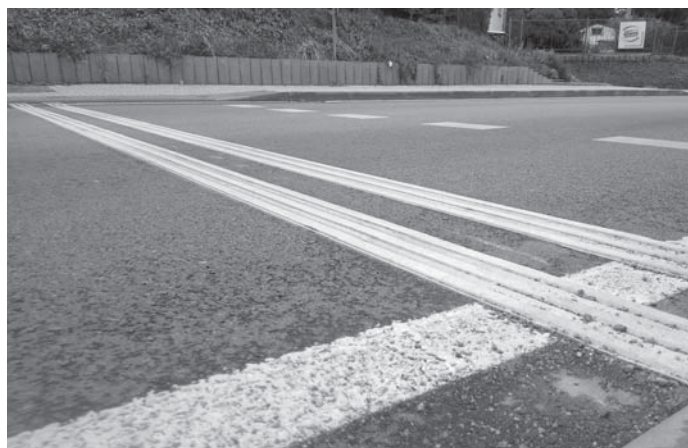
Vodící linie před odstraněním.