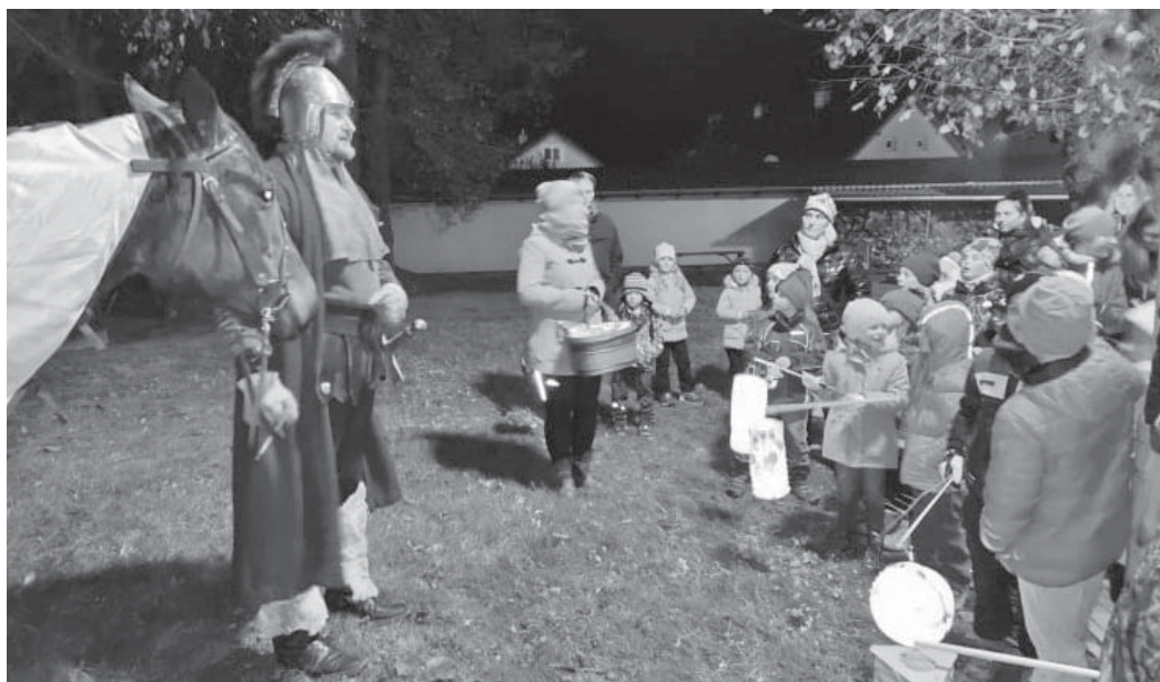
Děti přivolaný sv. Martin popisuje účastníkům slavnosti původ této křesťanské tradice.