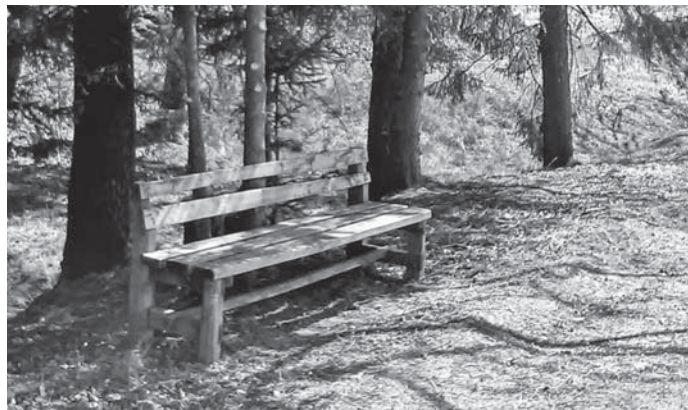
Jedno z míst pro odpočinek naleznete při cestě do lesa ve staré části Nové Vsi pod firmou V. Němce.

jako odrazový můstek pro nácvik akrobatických prvků. Celkem osm krytů těchto košů bylo rozlomeno. Musím si přiznat, že s každou instalací nového inventáře se pravidelně setkávám s názorem - „hlavně, aby ti to někdo nezničil“. Ano, právě tyto nešvary ukazují stav naší společnosti, ale nelze si stále dokola říkat, že některé věci je lepší nedělat. My se nevzdáváme, poškozené věci nevyhazujeme, stále jsou mezi námi šikovní lidé, kteří dokážou rozbitou součást za minimum nákladů opravit a těm patří velký dík. Marek Prokeš