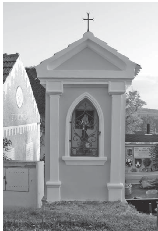
Fotografie kapličky před a po rekonstrukci svědčí o množství provedených prací.