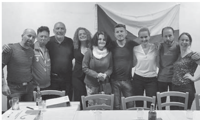
Kompletní soubor ochotníků po úspěšném představení v sále doubravické hospody.

Letošní divadelní sezóna se našemu ochotnickému spolku Novoveský utopenec rozjela jako dobře namazaný stroj. Divadelní představení „Zase Ti tupitelé“ pobavilo začátkem srpna nejen zastupitele, ale i ostatní obyvatele obce Doudleby, kde jsme si zahráli v sousedském duchu za pěkného počasí na obecní louce. Nevšedním divadelním zážitkem bylo pro nás vystoupení na Čakovském prkně ve stylové stodole jako vyvrcholení tamních obecních slavností. Dále jsme byli také vyžádáni hrát na nádvoří Borovanského zámku, kde jsme tuto hru za velkého aplausu už jednou ztvárnili. V Doubravici se smíchem diváci za břicha popadali. Samé zkoušky, představení, schůze ... Mjli blízce se domnívali, že se snad chystám své hospodské řemeslo pověsit na hřebík, koktejlové šejkry a ostatní barmanské nádobíčko věnovat dětem na písek, a že se začnu spolu s ostatními věnovat herectví.