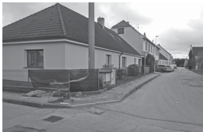
Pod povrchem chodníku je uložen rozcestník optického internetu.