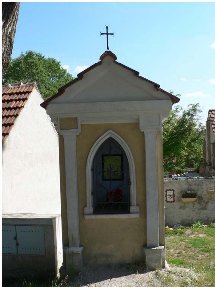
Kaplička Pod Lípou