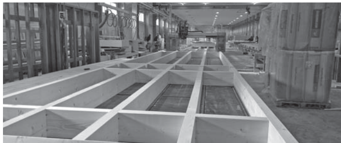
Výrobní závod společnosti NEMA DŘEVOSTAVBY s. r. o v Jílovicích

Jaká je představa o samotné stavbě, kolik vlastně bude stát a kdy by mohli do nové svazkové školy Malše nastoupit první žáci, se dozvíte v příštím vydání zpravodaje... – tak touto foglarovskou větou jsem v posledním vydání zpravodaje ukončoval prvotní informaci o připravovaném projektu svazkové školy Malše ve Vidově. Musím konstatovat, že zmínka popisující připravovaný záměr vyvolala poměrně slušnou odezvu, a to hlavně od rodičů, jejichž děti by mohly tuto školu navštěvovat. Jaká je tedy představa o samotné stavbě, která dokáže pojmout až 540 dětí? V současné době probíhá výběrové řízení na projektovou dokumentaci školy. Jestli stavba bude zděná, nebo třeba ve variantě dřevostavby rozhodne spousta faktorů. Jedním z nich je i role investorů a rychlost stavby. Jelikož se nejedná o jednoho, ale vlastně již o devět názorů, bude záležet hlavně na celkové členské shodě. Je v celku zajímavé sledovat, jak skrze sdělovací prostředky pronikají zprávy o tomto záměru