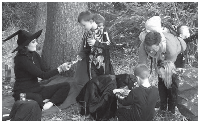
Na stanovišti u čarodějnice Kamči lovily děti jablka z lavoru naplněného vodou, aniž by přitom použily ruce.

Po naplánování hry byla na WhatsApp založena „rodičovská skupina“, v níž jsme se domlouvali na všem potřebném. Mnohdy jsem až s dojetím přihlížela, jak každý přispíval svým dílem, aby udělal něco krásného pro své blízké a hlavně aby všechny děti získaly nezapomenutelný zážitek.